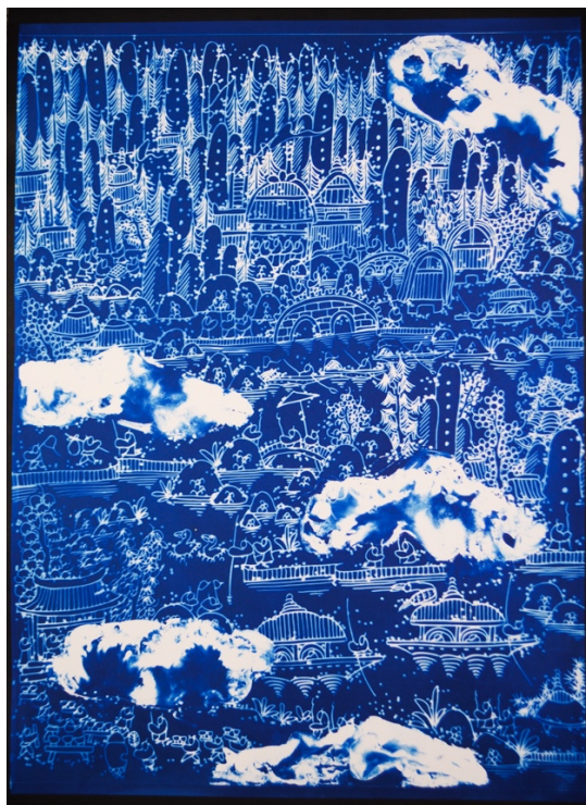
旅の途中 Size: W346mm × L422mm / Middle of the trip Size: W346mm × L422mm